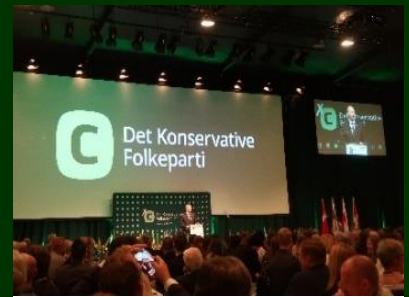
Søren Pape holder sin tale for de ca. 800 deltagere

Håber også du har lyst til at deltage næste år i Herning!