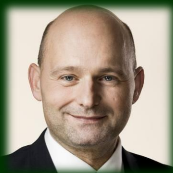
Af Søren Pape Poulsen, MF, Formand for Det Konservative Folkeparti

Vi er alle meget trætte af Corona, og jeg synes, det er imponerende, hvordan befolkningen har accepteret de mange restriktioner og gjort meget for at dæmpe smitten.