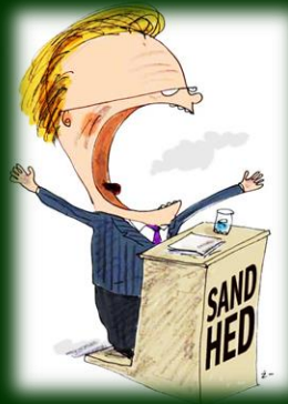
Fra Vejle Amts Dagblad

Naturligvis kan der pludselig opstå en konkret sag, som løber med al opmærksomheden. Det kan være en sag om en borger, der er udfordret på socialområdet, eller det kan være en sag om sygedagpenge inden for beskæftigelse. Det kan også være en konkret sag med en klage over vores servicetilbud i børnehaven eller i hjemmeplejen. Eller det kan være debat om fremtiden skoletilbud.