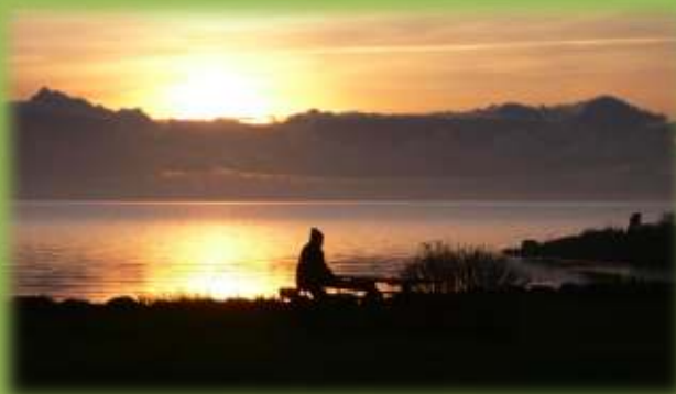
Sensommerstemning ved Ringkøbing Fjord...