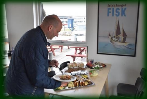
Besøg i Fiskehuset i Ringkøbing under valgkampen, maj 2019