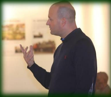
Fælles arrangement med SF i Vestjyllands Kunstpavillon, maj 2014