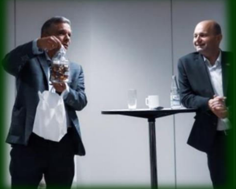
Julefrokost og politisk debat i vælgerforeningen, december 2019