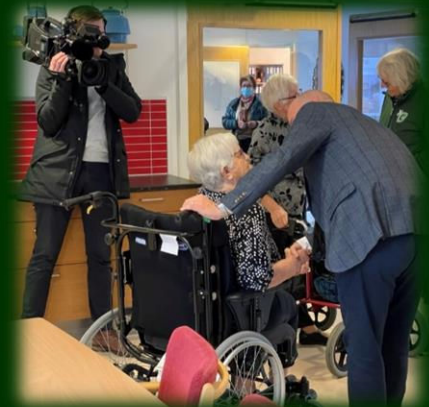
En hjælpende hånd og besøg sammen med de konservative kandidater på Ringkøbing Plejehjem under valgkampen november 2021