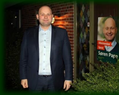
Kaffemøde i Skjern for medlemmerne februar 2016