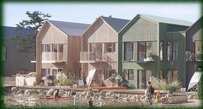
Raunonia-projektet, Illustration: Sweco

Raunonia-projektet i Ringkøbing Fjord vil formentlig også være et projekt, der ansøges om i den kommende tid.