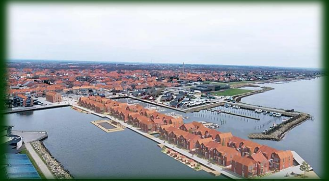
Det alternative projekt Fjordstaden, illustration Bay Arch

Der er ingen tvivl om, at det projekt, som vi skal tage stilling til, har betydelige forbedringer i forhold til tidligere forslag, så også dét bliver spændende. Og måske endnu mere nu, hvor der jo netop er præsenteret et måske alternativt nyt ferieby-projekt, Fjordstaden!