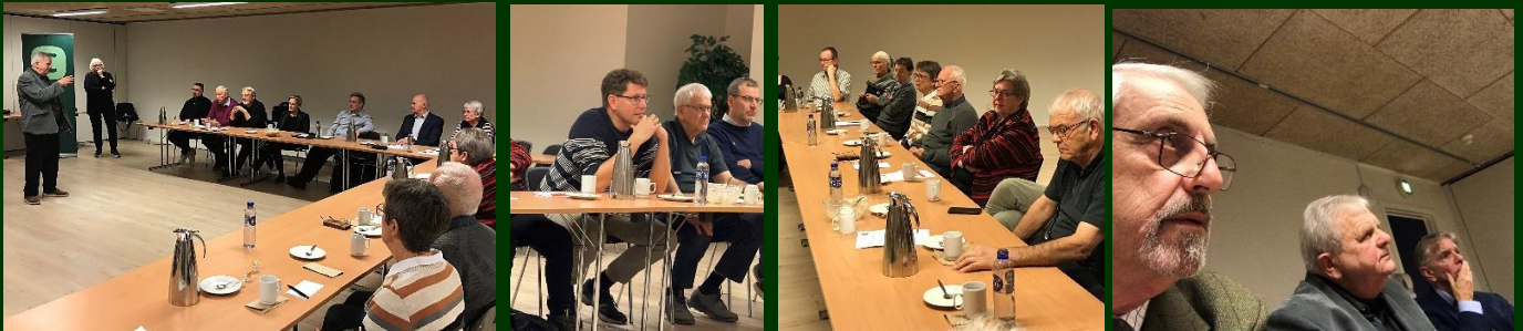
Det blev en livlig debat på generalforsamlingen under punktet 'Politisk drøftelse', hvor der både kom gode kommentarer, stillet gode spørgsmål til byrådspolitikerne og lyttet intenst til deres vurderinger og svar

Aftenen sluttede med fælles politisk drøftelse, hvor både byrådsgruppen og deltagerne udvekslede informationer og synspunkter i en livlig debat, hvor både overordnede emner og mere konkrete lokale politiske sagsforhold og spørgsmål på positiv og engageret vis fik ord med på vejen.