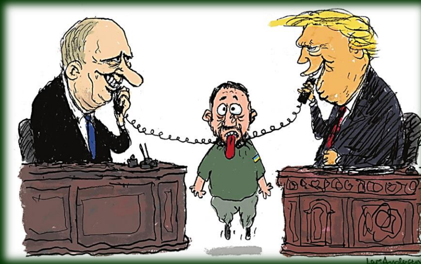
Illustration: Berlingske/Lars Andersen

Der er lang vej til nyt valg i USA, så der kan sikkert komme mange flere udtalelser, udmeldinger o.s.v i alle retninger. Jeg mener derfor heller ikke, at USA er i stand til at være "det styrende land" i eventuelle forhandlinger om afslutning af krigen mellem Rusland og Ukraine - og ikke mindst i samarbejde med Putin.